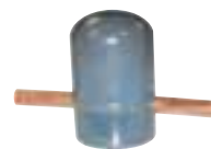
Kit de dégazage manuel 5000-202

Les N° servent au repérage des éléments dans le schéma p95