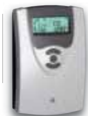
Régulation différentielle incluse SOL