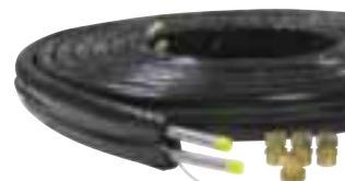
Canalisation flexible inox 5000-200